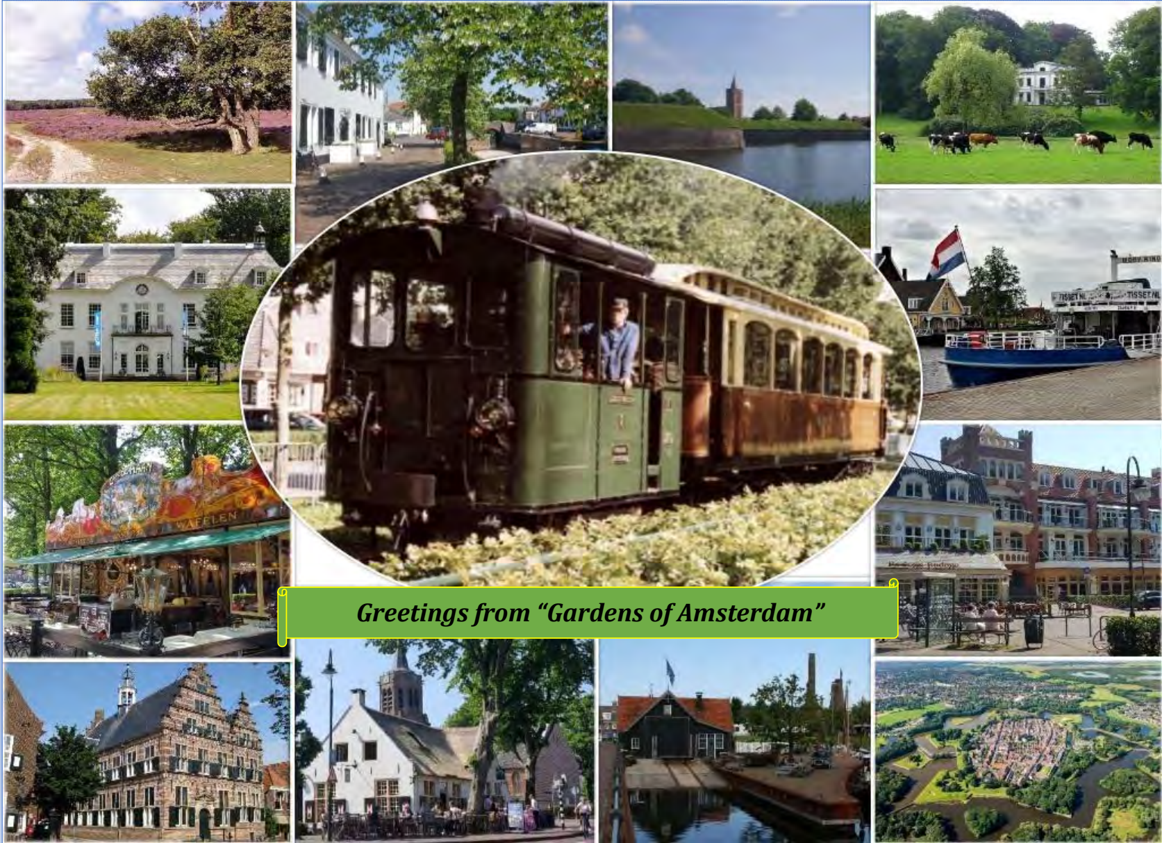
Greetings from "Gardens of Amsterdam"